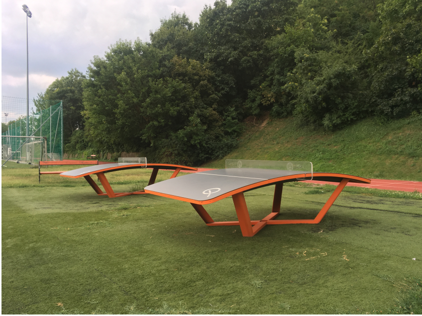
Tegball asztalok a Kolozsvári Tamás utcai Panoráma Sportközpontban